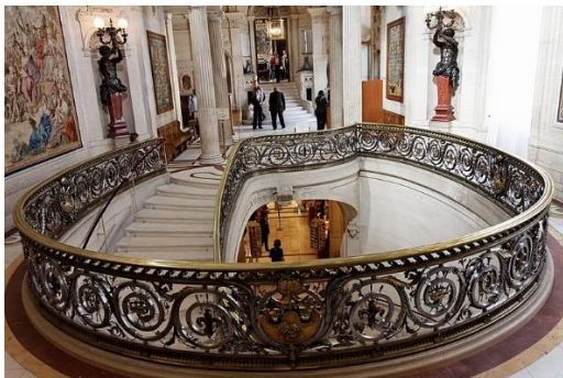
Le vestibule d'honneur