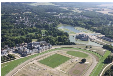
Vue des grandes écuries