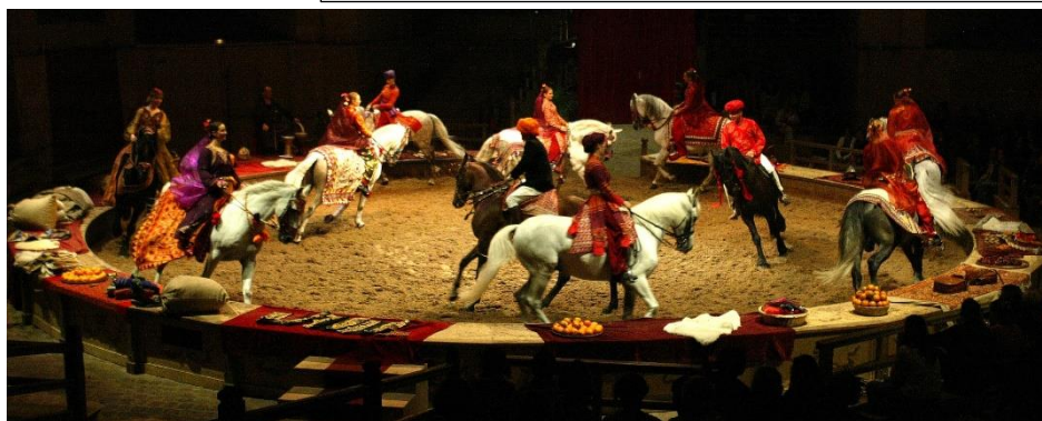
Le spectacle équestre TOTEM

- Balade commentée dans le parc (environ 35mn) en petit train : le jardin à la française dessiné par André Le Nôtre au XVIIe siècle, le jardin anglo-chinois à la fin du XVIIIe siècle et le jardin anglais au XIXe siècle.