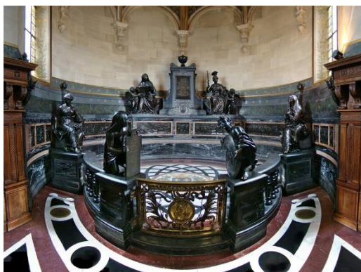
La chapelle des cœurs